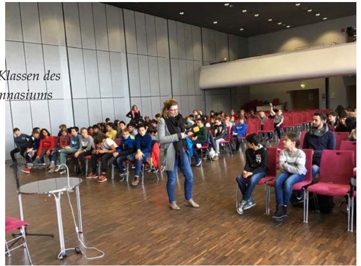
Schön, ein nahezu volles Haus zu haben; in den beiden ersten Reihen die Jurorinnen und Juroren aus den sechsten Klassen.

Woraus habt ihr gelesen? Zeigt her (nicht eure Füße, aber) eure Bücher!