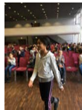
Matadoren auf dem Weg in die Arena!