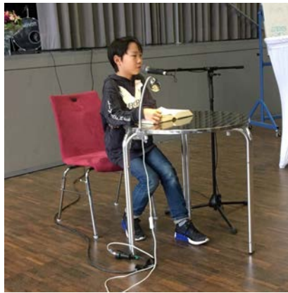
Matadoren in voller Konzentration!