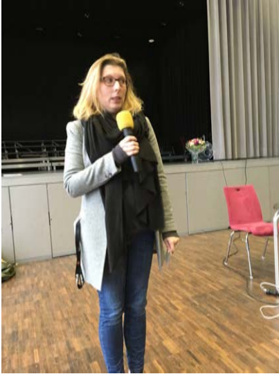
Gewohnt freundlich und professionell moderiert von Frau Weber.