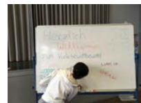
Wo ist bloß das Bild von Luka geblieben?